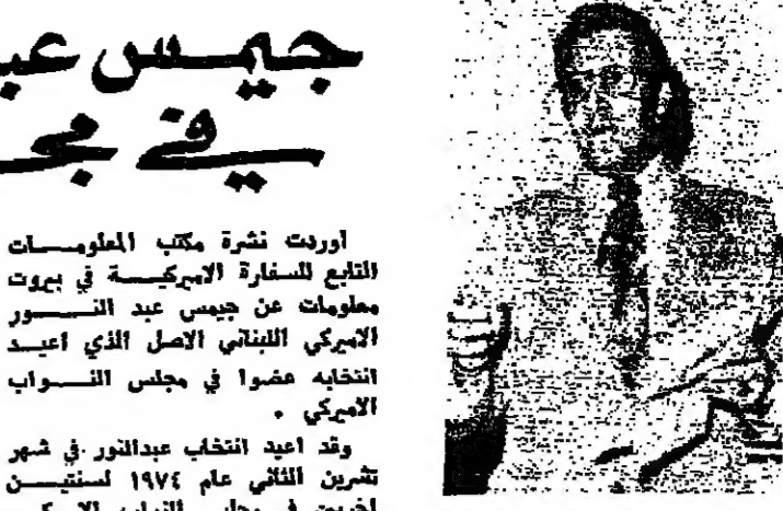
النائب اللبناني الامم جيمس عبد النور

جيمس عبد النور ولد في ١٩٠٦ في ولاية ساوث داكوتا ، وانتخب في الكونغرس من عام ١٩٦٧ إلى عام ١٩٧٤ .